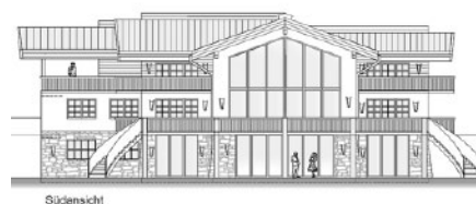
Landwirtschaft und Landhauspläne sollen Umwidmungsabsichten den Weg ebnen.

Nach einem Bericht vom „DerStandard“ vom 8.11.2013 hat die Grundverkehrsbehörde das Verfahren nun neu aufgerollt. Auch die Abteilung 7 Raumplanung sprach von „vielen Trickereien“ und kündigte an die