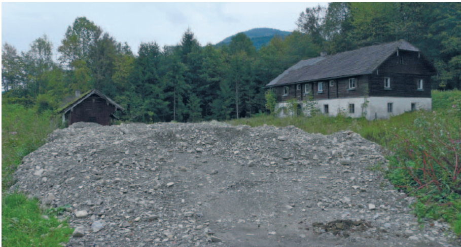
Vom Grundeigentümer bereits vorsorglich geschlägerte und aufgeschüttete Fläche

Salzburg droht Vertragsverletzung ohne zusätzliche Ausweisungen – Gewerbebetrieb soll in von der EU geforderten Flächen errichtet werden