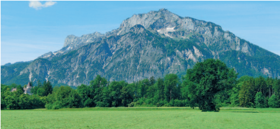
Naturnahe Kulturlandschaft im Landschaftsschutzgebiet Salzburg Süd, Anif

Hochwasserschutz für Stadt Salzburg wäre durch Golfplatz verhindert